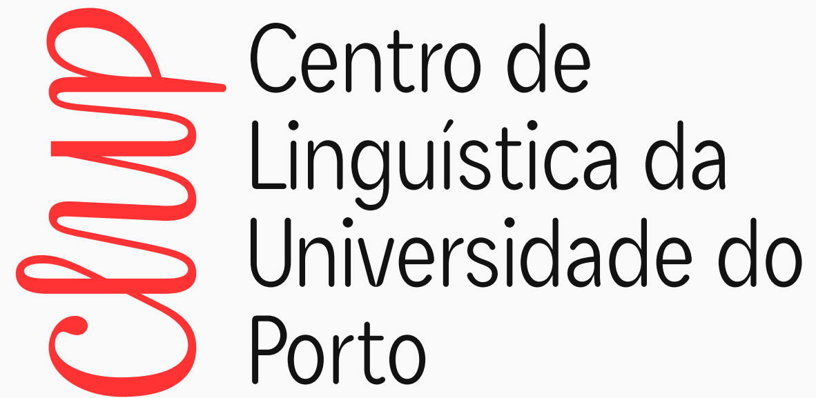
[ Logo Principal ]