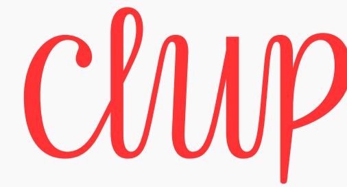
[ Logo Secundário ]